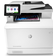
HP Color LaserJet Pro M479fnw

Dieser Drucker ist nur für die Verwendung mit Druckpatronen vorgesehen, die über einen neuen oder wiederverwendeten HP-Chip verfügen. Er nutzt dynamische Sicherheitsmaßnahmen, um Druckpatronen zu blockieren, die einen nicht von HP stammenden Chip aufweisen. Regelmäßige Firmware-Updates erhalten die Wirksamkeit dieser Maßnahmen aufrecht und blockieren Druckpatronen, die zuvor funktioniert haben. Ein wiederverwendeter HP-Chip ermöglicht die Verwendung von wiederverwendeten, wiederaufbereiteten und wiederbefüllten Druckpatronen. Mehr dazu unter: http://www.hp.com/learn/ds