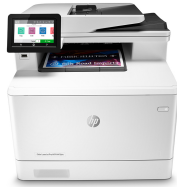
HP Color LaserJet Pro M479dw

Geschäftlich erfolgreich zu sein bedeutet, smarter zu arbeiten. Der HP Color LaserJet Pro MFP M479 ist so konzipiert, dass Sie Ihre Zeit auf eine effektive Unterstützung des Unternehmenswachstums konzentrieren können und gleichzeitig der Konkurrenz einen Schritt voraus sind.